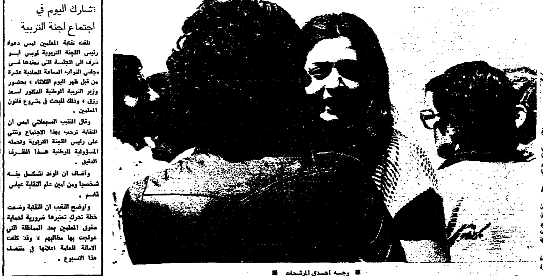
وجهه احدى المرشحات